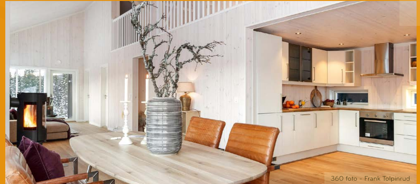
360 foto - Frank Tolpinrud