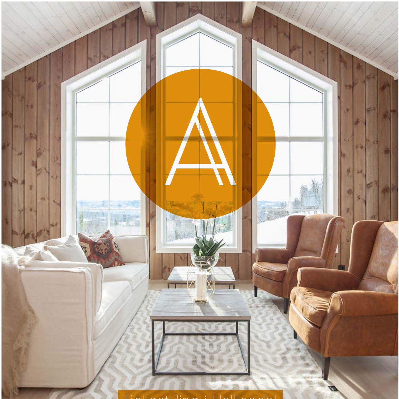
Boligstying i Hallingdal